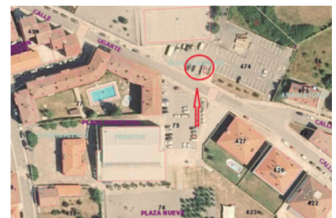
Traslado y cierre de contenedores.